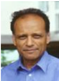
۲. (Professor Sir Partha Dasgupta)

کلارک استاد تاریخ اروپای مدرن کالج سنت کاترین ( St Catharine's College) دانشگاه کمبریج است. حوزه علائق پژوهشی بر تاریخ آلمان و اروپای قاره ای قرن نوزدهم متمرکز می باشد. آثار اولیه او در حوزه تاریخ سیاسی و فرهنگی دین بوده است. اولین کتاب کلارک مطالعه رابطه بین مسیحیان و اقلیت یهودی در پروس بین ۱۷۲۸ و ۱۹۴۱ بود. در این کتاب او راه هایی که فهم معاصر مسیحیت به واسطه آن شکل تغییرات متوالی از فهم «مسئله یهود» را شکل داده است را مورد بررسی قرار داده است. سایر مقالات و نوشته های او نیز به مسأله نقش اقتدار دولت در حل مسائل مذهبی و نیز تأثیر پیوستگی های مذهبی بر تغییرات سیاسی و فرهنگی بوده است.