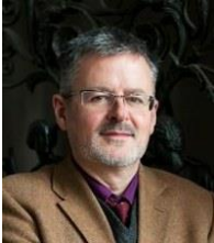
۱. (Professor Chris Clark)

کلارک استاد تاریخ اروپای مدرن کالج سنت کاترین ( St Catharine's College) دانشگاه کمبریج است. حوزه علائق پژوهشی بر تاریخ آلمان و اروپای قاره ای قرن نوزدهم متمرکز می باشد. آثار اولیه او در حوزه تاریخ سیاسی و فرهنگی دین بوده است. اولین کتاب کلارک مطالعه رابطه بین مسیحیان و اقلیت یهودی در پروس بین ۱۷۲۸ و ۱۹۴۱ بود. در این کتاب او راه هایی که فهم معاصر مسیحیت به واسطه آن شکل تغییرات متوالی از فهم «مسئله یهود» را شکل داده است را مورد بررسی قرار داده است. سایر مقالات و نوشته های او نیز به مسأله نقش اقتدار دولت در حل مسائل مذهبی و نیز تأثیر پیوستگی های مذهبی بر تغییرات سیاسی و فرهنگی بوده است.